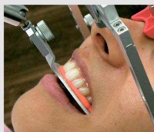
Лицевая дуга после регистрации прикуса.