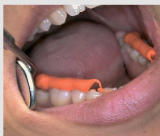
Прямое нанесение O-Bite.