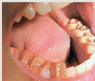
Регистраторы прикуса перед снятием.