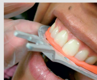
Регистрация с помощью прикусной вилки для лицевой дуги.