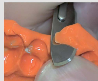
Простая обработка скальпелем или фрезой для силикона.