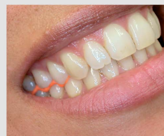
Пациент с желаемой окклюзией.