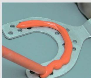
Нанесение O-Bite на прикусную вилку.