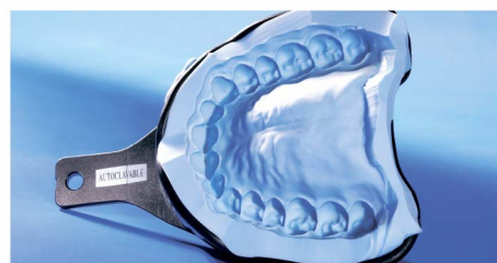
Точный оттиск, выполненный с помощью материала StatusBlue.