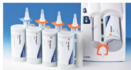
Картриджи для динамического смешивания в аппарате MixStar-eMotion.