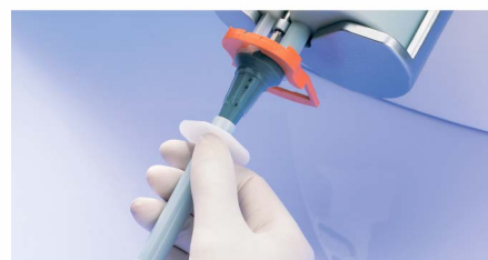
Легкое наполнение шприца на 1 скорости.