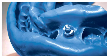
Трансферный оттиск из материала Honigum-Heavy.