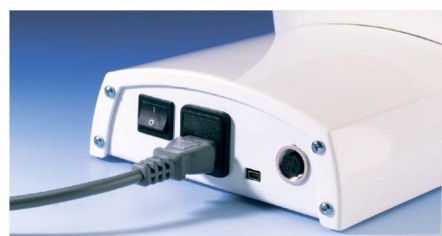
Разъем для ножной педали и USB-порт для обновления программного обеспечения.