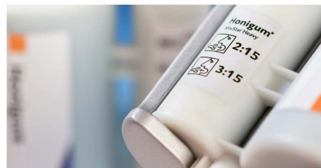
Цветовая кодировка и этикетка с указанием рабочего времени и времени затвердевания.

Оптимизированные картриджи MixStar имеют цветовую кодировку для быстрой идентификации продуктов. Кроме того, для облегчения выбора и исключения ошибок на упаковках указаны рабочее время и время полимеризации соответствующего материала.