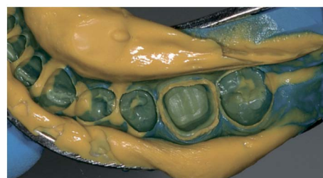
Детальное воспроизведение протезного ложа при помощи материалов Honigum-MixStar Putty и Honigum-Light.