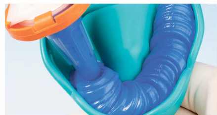
Быстрое заполнение ложки на 2 и 3 скоростях.