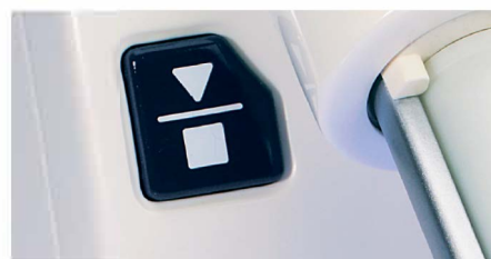
Кнопка «Старт-Стоп» для автоматического смешивания.