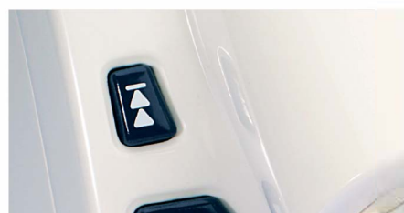
Кнопка для быстрой смены картриджа.